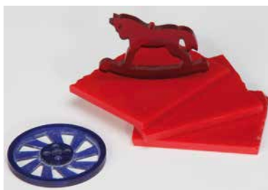
[166 PLEX S] Special colored Acrylic 50x50x3 mm, usable for milling (cast acrylic) (packing unit 30 pcs) for 3-axis milling