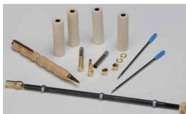
[163 600 S] Penmaker Set for 2 wooden Pens incl. mandrel (packing unit 8 Sets)