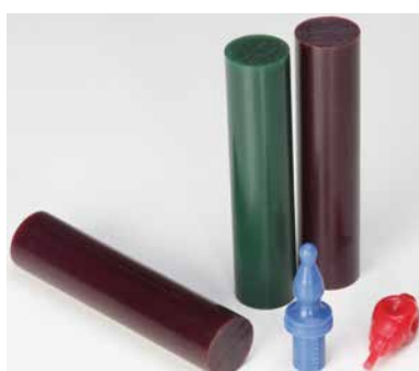
[166 WAX S] Jeweller wax ø35x150 mm, ideal for milling and turning without cooling (packing unit 8 pcs)