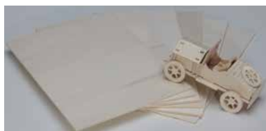
[163 300 A4 S] Poplar plywood 4 mm, 210x297 mm (packing unit 30 pcs)

Filigrandrehseln, Puppenmöbel, Holzschmuck, etc.