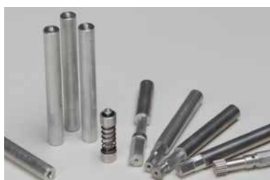
[166 ALU S] Aluminium ø12x100 mm, center drilled (packing unit 15 pcs)