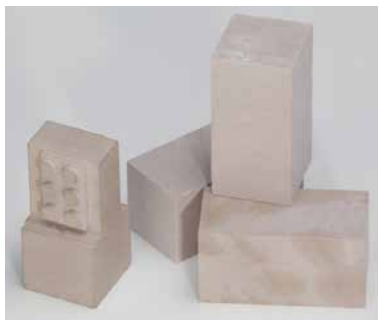
[166 FOAM S] Special milling foam medium density, for 3D projects on multiaxis machines (packing unit 30 pcs)