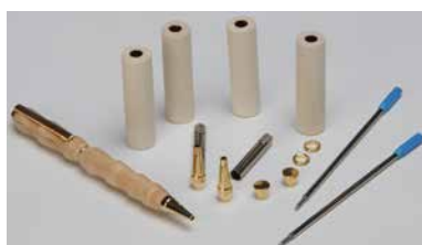
[163 900A S] Wooden pens blank maple incl. mechanical parts (packing unit 15 Sets) for beech - 163 900B S for walnut - 163 900N S