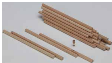
[163 100 B06 S] Beech rods ø6x150 mm (packing unit 200 pcs)

Miniature work, dollhouses, wooden jewelry, etc.