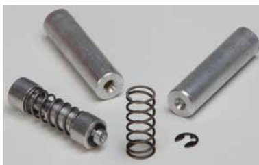
[166 FED S] Spring element ø12 mm aluminum rods cut, spring, retaining washer, .... (for metal lathe) (packing unit 15 pcs)