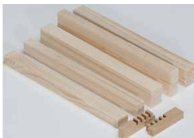
[163 LEI S] Wood ledge for Project „finger-joint“ (packing unit 30 pcs)