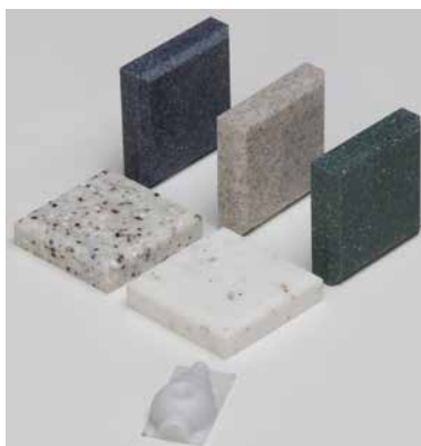
[166 COR S] Corian (artificial stone) 50x50x12 mm (packing unit 15 pcs)